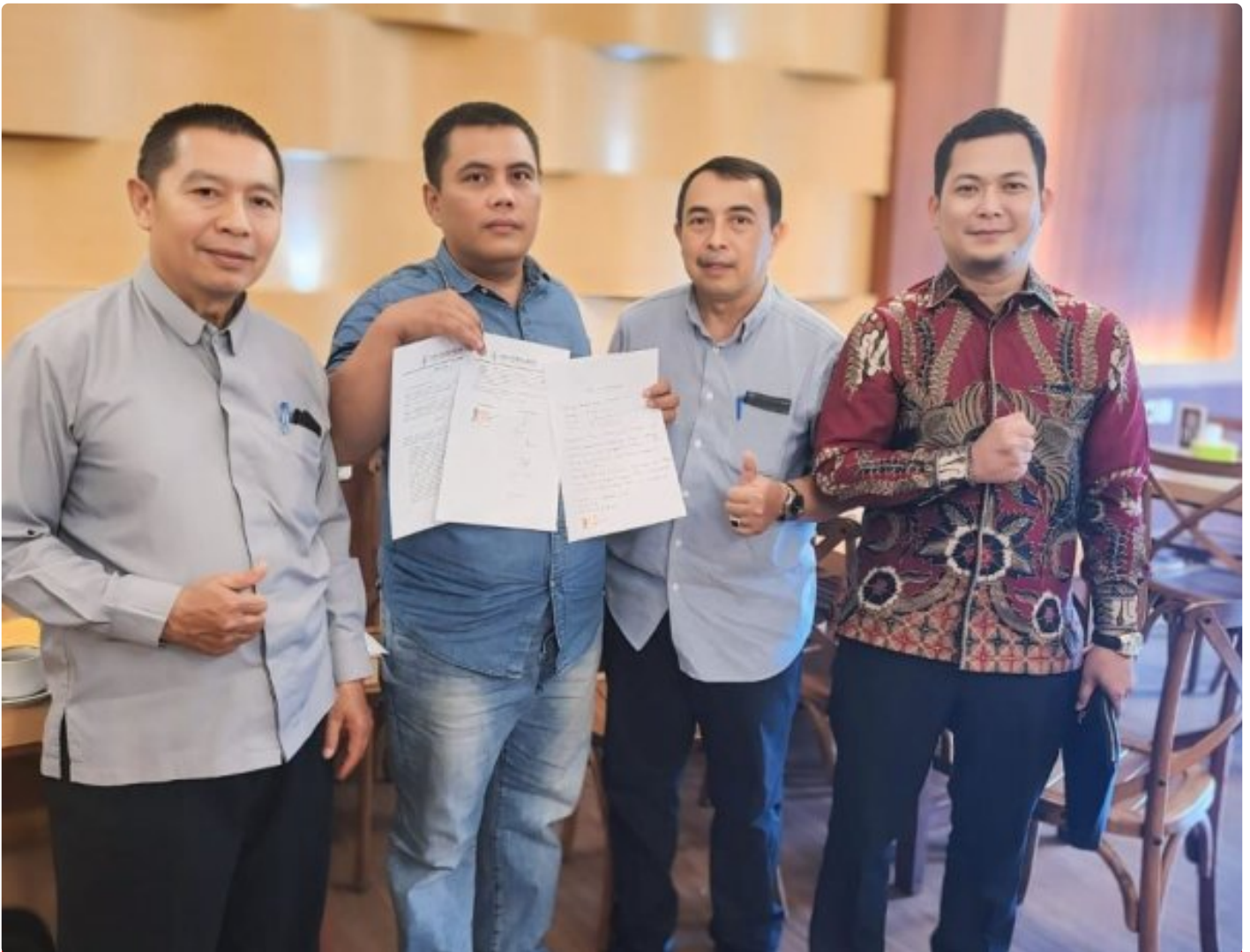
Kuasa Hukum Ningto Wahyu Dens & Partners Lawfirm di perkara Dugaan Pemalsuan Data dan Kredit Fiktif di Bank BRI Unit Kalideres.